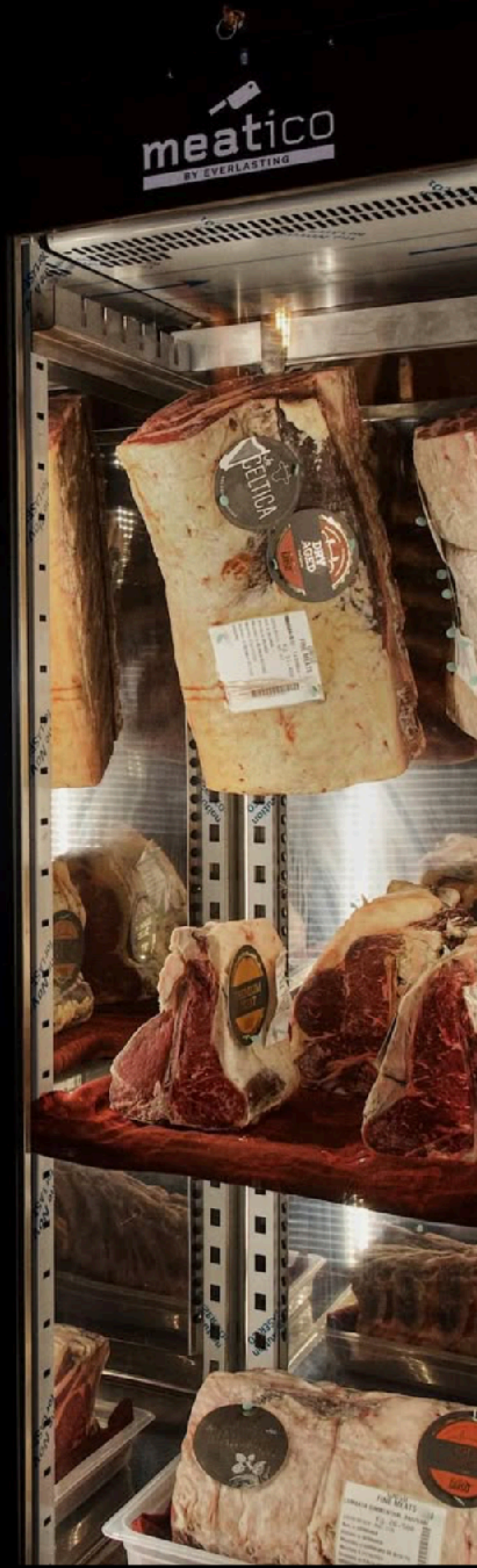
RAW bistrot, lago d'Iseo